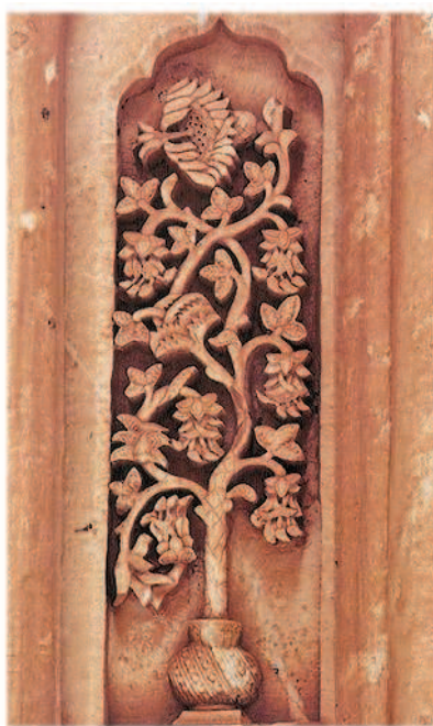
Мировое дерево в культуре разных народов