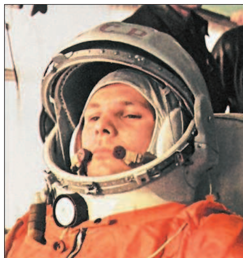
Первый космонавт Юрий Алексеевич Гагарин

Планета Земля удивительно красива. Первый космонавт мира, наш с вами соотечественник Юрий Алексеевич Гагарин, вернувшись из полёта, сказал: «Облетев Землю в корабле-спутнике, я увидел, как прекрасна наша планета. Люди, будем хранить и приумножать эту красоту, а не разрушать её!»