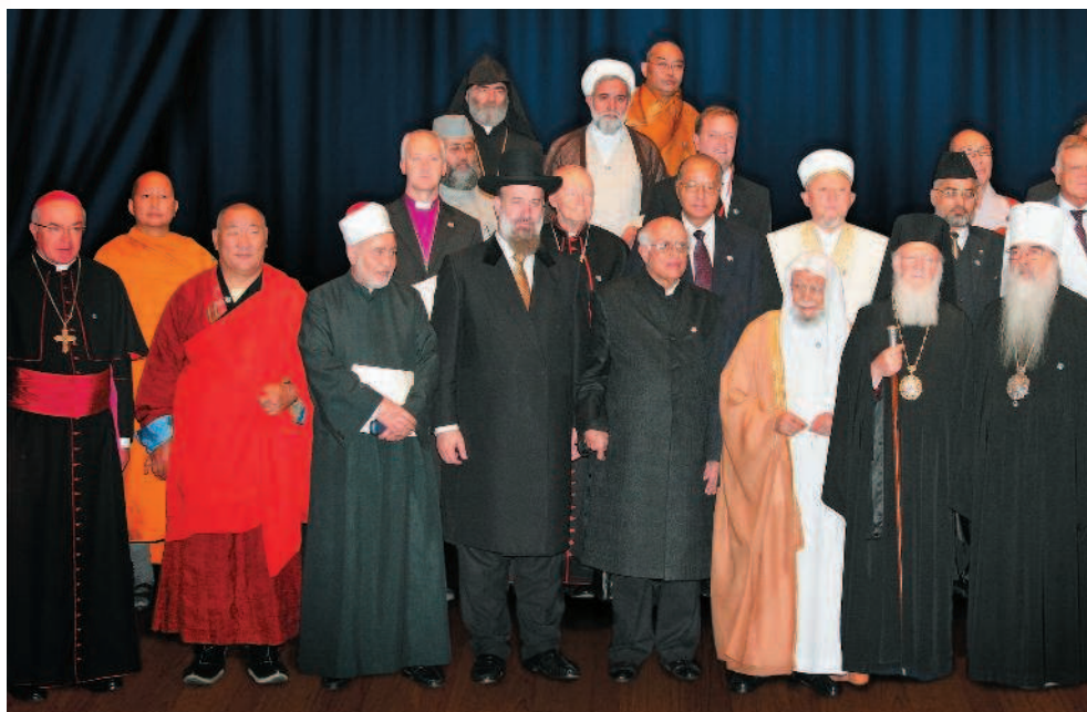
Лидеры мировых и традиционных религий в Астане

• призыв поддержать и объединить усилия для построения справедливого, безопасного и процветающего мира и заканчивается замечательными словами: «Мы желаем каждому человеку мира, добра и благоденствия!»