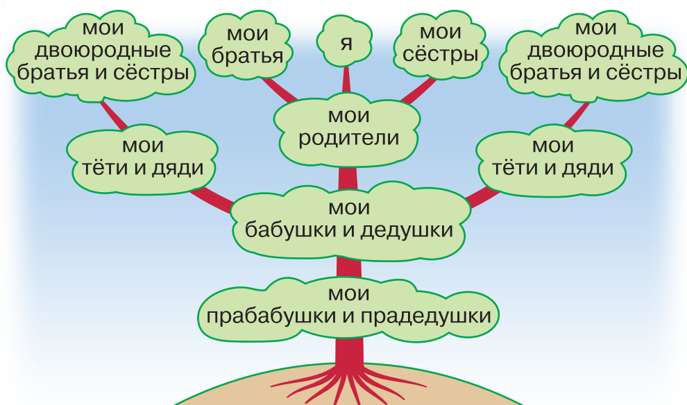
Схема родословного дерева