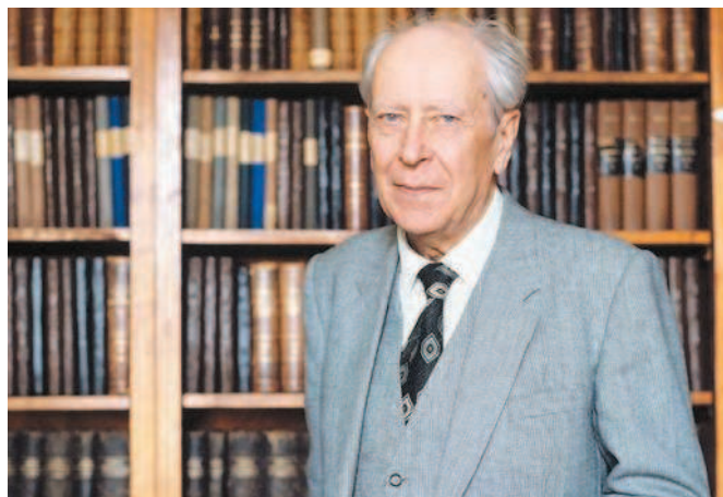
Дмитрий Сергеевич Лихачёв

Люди издавна населяют и преобразуют Землю — наш общий дом. Известный российский учёный, историк Дмитрий Сергеевич Лихачёв сказал об этом: «Когда-то... мне пришёл в голову такой образ: Земля — наш