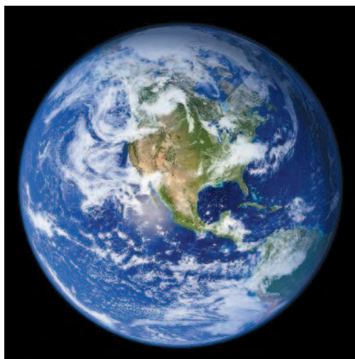
Планета Земля из космоса