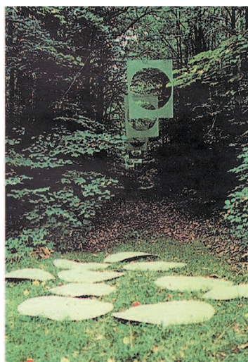
Перформанс «Интервалы». Группа «Коллективные действия». 1988 г.