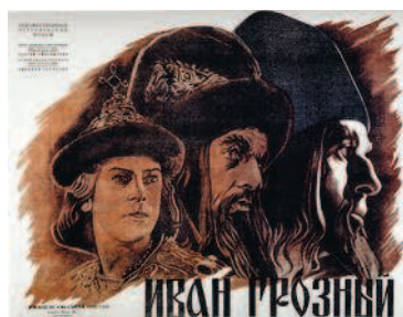
Кадр из фильма с совмещением крупного и общего плана