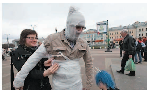
Хеппенинг во время первомайской демонстрации. 2011 г.

тели активно вовлекают случайную публику в загадочные, а порой алогичные действия. В их распоряжении разнообразный реквизит, состоящий из бывших в употреблении вещей, яркие нелепые костюмы, подчёркивающие неодушевлённость персонажей. Подобная игра носит импровизационный характер, каждый участник может в любой момент выйти из неё.