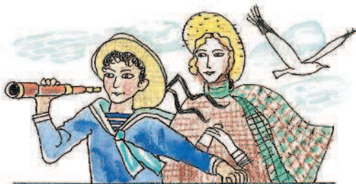
Дети капитана Гранта

Литературных персонажей этих книг можно встретить и на экранах телевизоров, и в кинотеатрах.