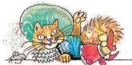
Кот в сапогах