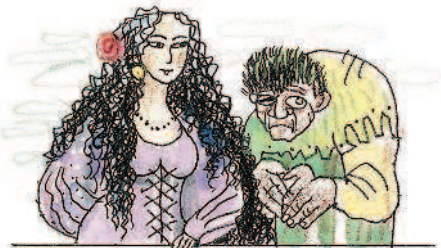
Эсмеральда и Квазимодо

Во всём мире известна продукция французской промышленности.