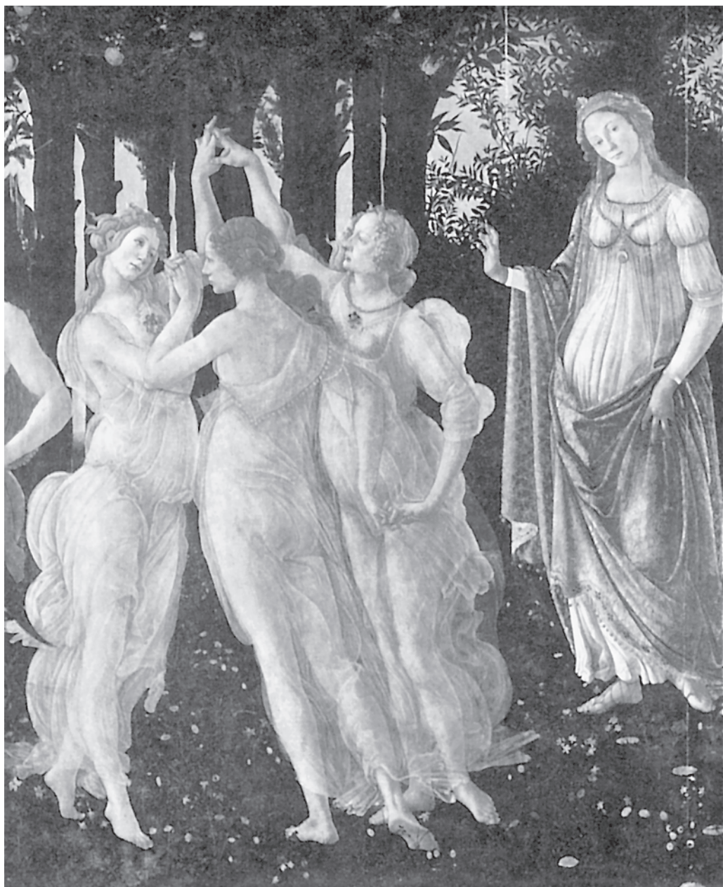
С. Боттичелли. Весна. Фрагмент

М Какие из изображённых на этих картинах сюжетов могут стать темой музыкальных произведений? Объясни свой выбор.