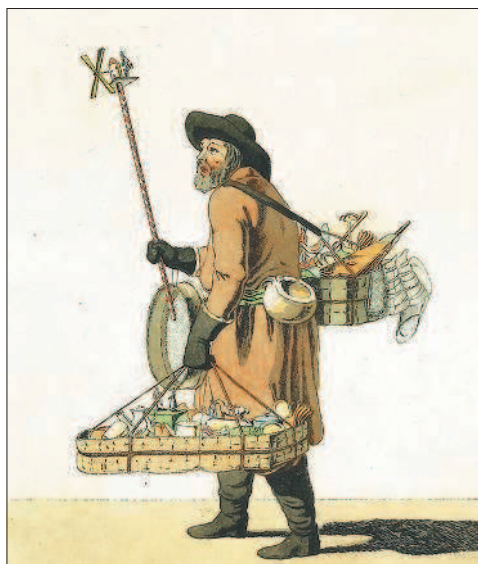
Торговец игрушками. Гравюра Х.-Г.-Г. Гейслера

2. Влияние крепостничества на развитие сельского хозяйства. О кризисе традиционных отношений свидетельствовало и начавшееся имущественное расслоение крестьян на «крепких» хозяев, середняков и бедняков . Последние всё чаще выступали в качестве наёмных рабочих в хозяйствах своих более удачливых и умелых односельчан. Кроме того, хотя основной формой крестьянских повинностей, особенно в чернозёмных губерниях, оставалась барщина , заметно выросло значение отходничества — временного ухода селян на заработки.