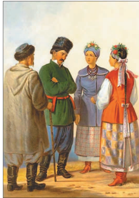
Малороссы. Литография Г.-Т. Паули

ние нескольких десятилетий вырабатывали собственные позиции консерваторы, либералы и революционеры, причём последние выбрали самый сложный и интересный путь. Так, в частности, в движении дворянских радикалов (декабристов) либерализм и революционность были тесно переплетены, а в начале 1850-х гг. революционеры создали теорию особого «русского (общинного) социализма» — своеобразную разновидность популярного тогда европейского утопического социализма.