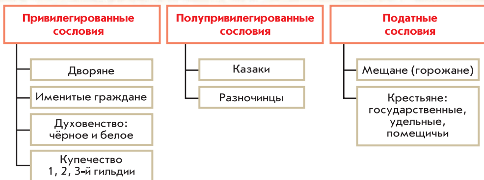
Сословная иерархия в начале XIX в.

На протяжении всего XIX столетия население России делилось на привилегированные , полупривилегированные и непривилегированные сословия. К первым относились потомственные и личные дворяне, священнослужители и купцы, ко вторым — казаки и разночинцы. Основными непривилегированными сословиями являлись крестьяне, мещане и работные люди (позже названные рабочими).