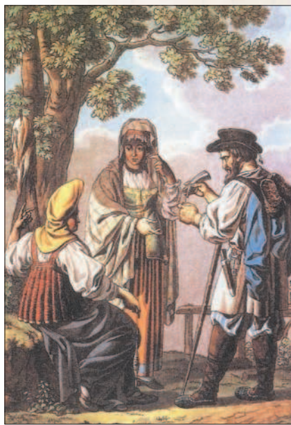
Русские крестьяне в 1812 г. Гравюра

Вместе с тем в деревне наблюдались новые процессы, которые всё заметнее подрывали традиционную крепостническую систему. Постоянно росла товарность хозяйств, т. е. всё больше продуктов производилось не для внутреннего потребления, а на продажу. Это подталкивало помещиков к развитию сельскохозяйственного производства, переходу от натуральной системы хозяйствования к денежной. Они сдавали в аренду своим крестьянам пустующие земли, торговые места в имении, луга, мельницы. Предприимчивые и инициативные крестьяне, их называли «капиталисты», отличались от основной массы сельских жителей. Новые, сложившиеся в деревне отношения совершенно не укладывались в рамки крепостнических порядков.