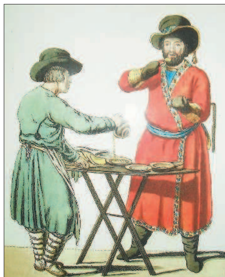
Продавец киселя и кучер. Гравюра Х.-Г.-Г. Гейслера