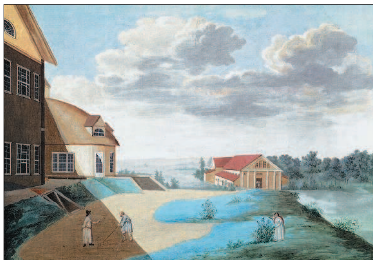
Барская усадьба в 1820-е гг. Неизвестный художник

Помещики с целью повышения доходности своих имений изобретали новые системы — «брат за брата» (когда в семье половина работников занята на барщине, а другая половина освобождена от неё) или урочную (определение урока — дневной нормы выработки для каждого работника), однако эти ухищрения помогали слабо. Некоторые землевладельцы пытались применять передовые методы ведения сельского хозяйства: переходили на многопольный севооборот, приглашали иностранных специалистов-фермеров, покупали машины и механизмы, новые сорта зерна и породы скота, использовали удобре-