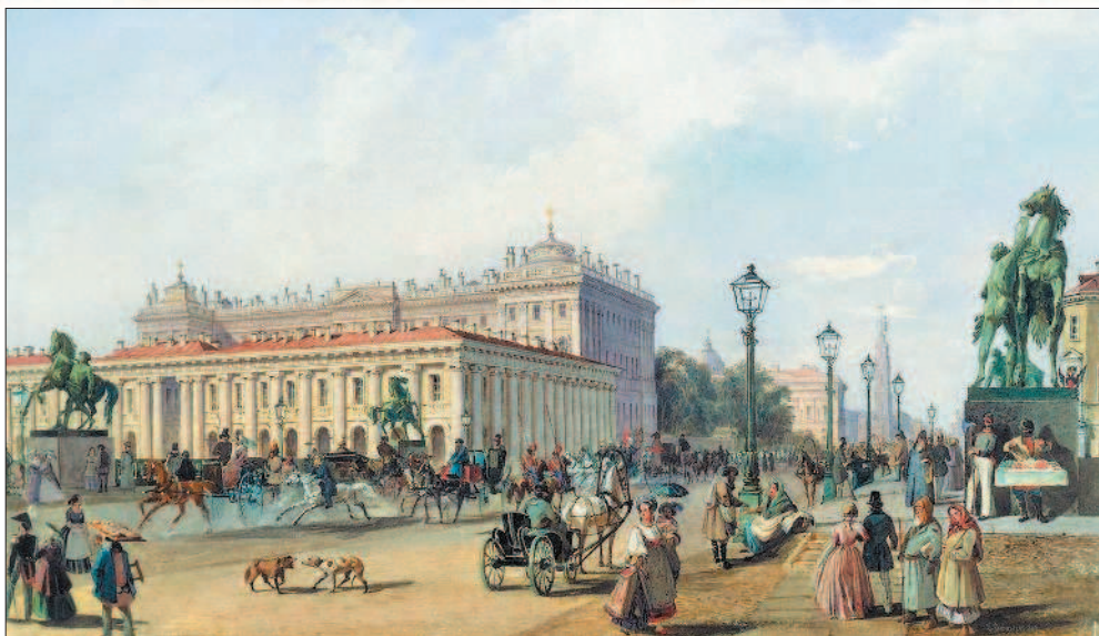
Вид Аничкова моста в Петербурге. Художник В. С. Садовников

нейшего развития страны. Усложнение внутренней структуры политических лагерей повлекло за собой оформление различных течений, порой противопоставлявших себя друг другу. Наиболее заметные изменения такого рода произошли в либеральном и революционном лагерях.