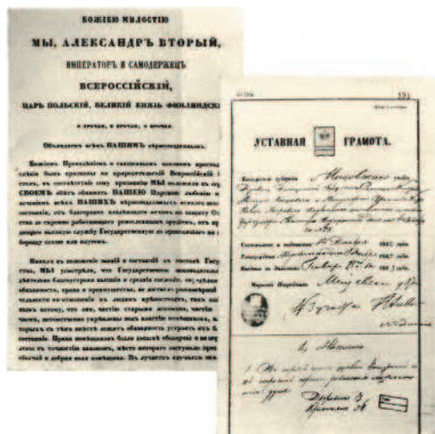
Манифест об отмене крепостного права и уставная грамота 1861 г.

Во многом поэтому реформы 1860—1870-х гг. воспринимались обществом как недостаточно системные, а то и просто половинчатые, побуждая представителей различных политических лагерей искать и предлагать собственные варианты даль-