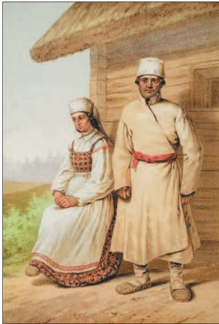
Белорусы. Литография Г.-Т. Паули