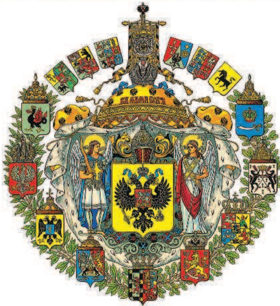
Большой герб Российской империи. 1882 г.

ла не к демократизации (на что рассчитывали радикалы), а к ужесточению политического режима и краху революционного народничества. Его место чуть позже заняли различные политические группы и течения — от неонародников до марксистов.