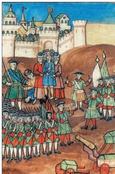
Взятие Азовской крепости. Миниатюра из рукописи XVIII в.

«Марсовы и Нептуновы потехи» Петра I сформировали круг его пристрастий. Это морское (судостроение), артиллерийское и военное дело. Существует даже соблазн упрекнуть Петра в слишком затянувшейся страсти к «потехам». Но это было бы несправедливо. Нельзя забывать, что из петровских «забав» выросли многие преобразования. Игра в «потешных» оказалась неразрывно связана с военной реформой и созданием регулярной армии, страсть к морю привела к строительству военного флота, всё вместе — к заведению мануфактур и открытию школ для будущих офицеров и моряков. Пётр формировался как «государственный человек», все помыслы которого направлены на служение Отечеству.