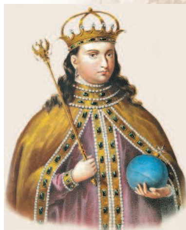
Царевна Софья Алексеевна. Портрет из альбома «Российский царственный дом Романовых». 1853 г.