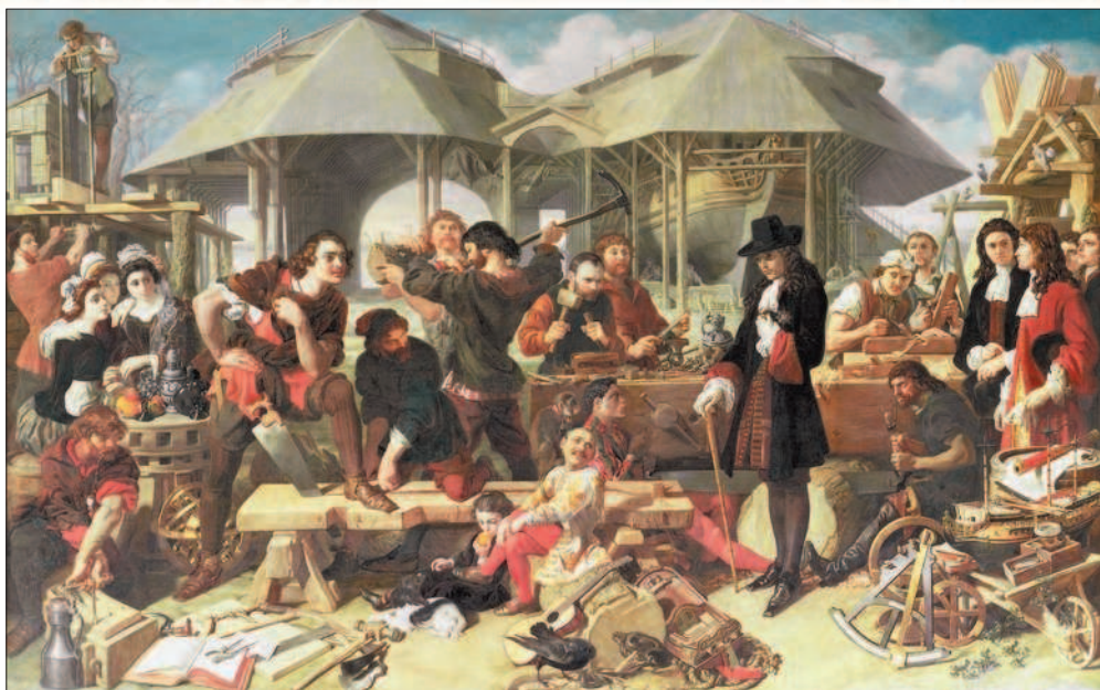
Пётр I в Голландии. Художник Д. Маклиз

ли: приглашение специалистов, связанных с морским делом, закупка морского снаряжения, оружия, научных приборов, обучение новым профессиям. Была и ещё одна важная цель — дипломатическая: «оживить» антитурецкий союз. Дело в том, что в Европе назревала новый конфликт — Война за испанское наследство. Союзники Петра, добившись перелома в борьбе с Турцией, теперь тяготились войной и готовы были начать мирные переговоры с турками. Пётр, однако, ещё надеялся, что ему удастся восстановить антитурецкую коалицию.