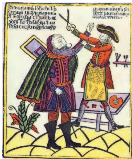
Указ о бритье бород. Лубок. Начало XVIII в.

В Москве царь сразу же принялся вводить «чужеземные обычаи с манера немецкого». Чувствовалось, что молодой государь не имеет ни чёткого представления о преобразовании страны, ни плана реформ . Видимо, им больше двигало желание поскорее сделать Россию хотя бы внешне похожей на Европу. Начал он с боярских бород, которые стали для Петра символом косной старины. Первые бороды Пётр отрезал собственноручно. Затем наступил черёд для русского платья: дворянству указа-