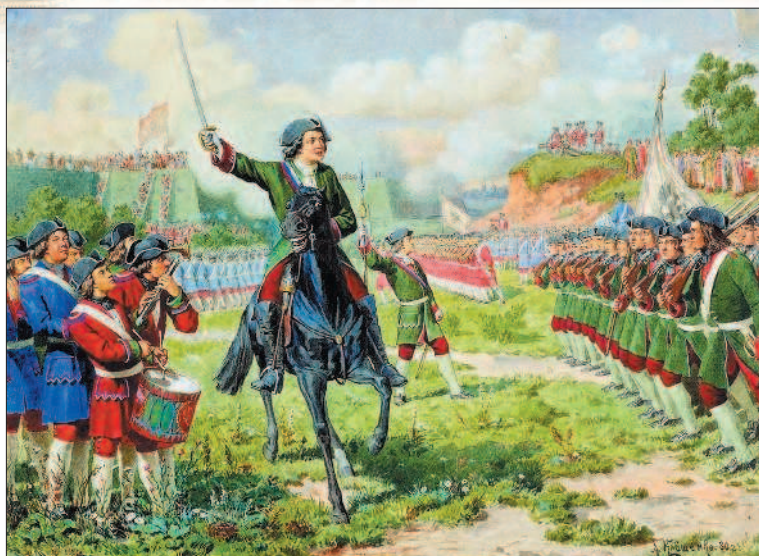
Военные игры потешных войск Петра I под селом Кожуховом. Художник А. Д. Кившенко

нулся к прерванным «потехам». Со временем оказалось, что военные игры царя были больше, чем просто игры.