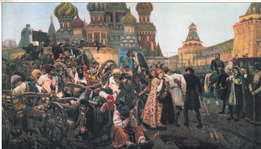
Утро стрелецкой казни. Художник В. И. Суриков

но было сменить долгополые одежды на короткие европейские кафтаны. Указом от 20 декабря 1699 г. с 1700 г. изменялся порядок отечественного летоисчисления. Отныне отсчёт приказано вести не от Сотворения мира, а, как в Европе, от Рождества Христова. При этом новолетие наступало не 1 сентября, а 1 января.