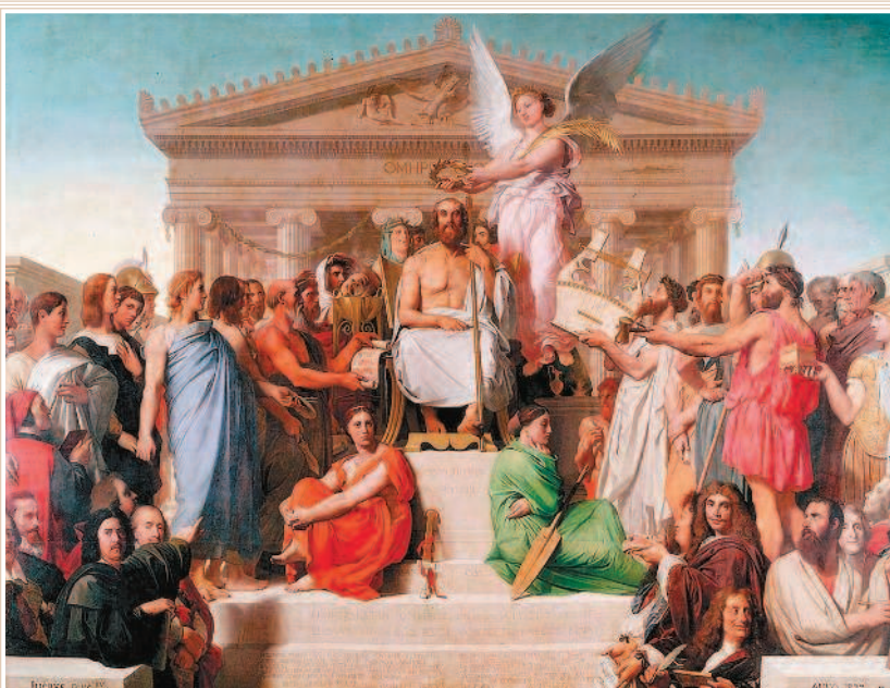
Ж.-О.-Д. Энгр. Апофеоз Гомера

му Гомера считают автором большинства эпических песен, гимнов и поэм.