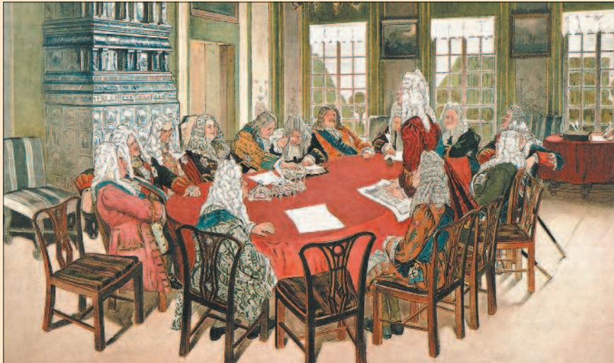
Д.Н. Кардовский. Сенат петровского времени

этот орган сможет осуществлять управление страной в его отсутствие, а в дальнейшем избавит от необходимости вникать во множество мелких вопросов. Надежды императора во многом оказались тщетными. В условиях, когда вся полнота власти со-