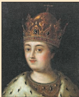
А.П. Антропов. Портрет царевны Софьи

В результате династической борьбы власть в своих руках сосредоточила образованная, честолюбивая сестра Петра I Софья . Опираясь на правительство, главную роль в котором играли В.В. Голицын и Ф.Л. Шакловитый, ей удалось заключить мир с Речью Посполитой, договор с Китаем.