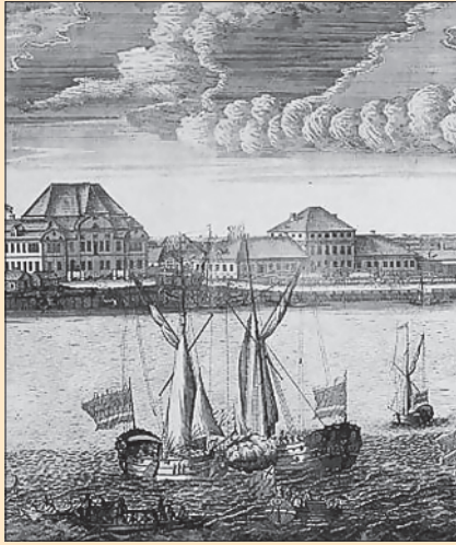
А.Ф. Зубов. Панорама Петербурга. 1716 г.

мени, органы центрального и местного управления не справлялись с новыми масштабными задачами. У Петра существовал определённый идеал государственного устройства России. Он мечтал, чтобы каждый орган, каждый чиновник имел чётко определённую сферу и порядок деятельности. Государство должно было работать как часовой механизм, где все винтики обеспечивают его бесперебойную работу.