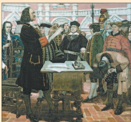
Д.Н. Кардовский. Смотр новиков. Фрагмент

Служба требовала от дворянина знаний. Пётр запретил дворянам, не постигшим основ наук, жениться. Молодые дворяне направлялись за границу для прохождения обучения. Поступая на службу, дворянин должен был постепенно проходить все ступени служеб-