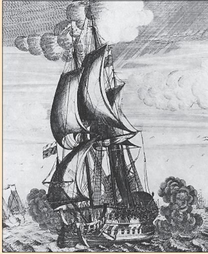
А.И. Ростовцев. Корабль «Гото Предестинация». 1718 г.