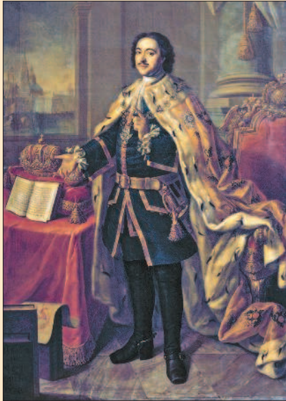
А.П. Антропов. Портрет Петра I

Пётр считал возможным добиться превращения России в одну из ведущих держав Европы путём заимствования достижений европейской цивилизации.