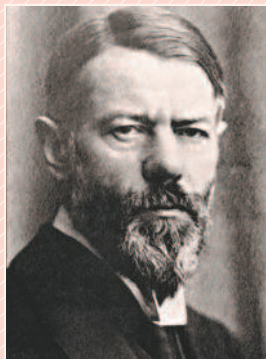
М. Вебер (1864—1920)

В настоящее время трактовки термина «политика» предельно разноречивы. Он используется и в обыденном (широком), и в узком (научном) значении. На обыденном уровне под политикой чаще всего понимается любая деятельность, связанная с управлением и руководством. В этом смысле можно говорить о политике президента, губернатора, мэра или о политике любой структуры, будь то школа, вуз, завод, фирма.