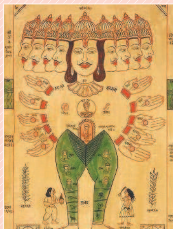
Происхождение индийских каст. Древний рисунок

В мифе о похищении Европы говорится, что от её союза с Зевсом (явившемся в образе быка) родился легендарный царь «столицы» древнего Крита — Кносса. Какая связь между этим мифом и тотемизмом?