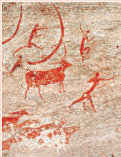
Охота первобытных людей. Наскальная живопись

Мифы — это сказания древних людей о происхождении мира, человека и богов.