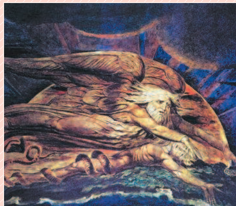
У. Блейк. Сотворение Адама

Значительная часть населения Земли придерживается библейской версии происхождения человека. Священная книга всех христиан, Библия, состоит из Ветхого Завета и Нового Завета. Ветхий Завет признаётся священной книгой не только христианами, но также мусульманами и иудеями. Сюжеты Ветхого Завета тесно связаны с исторической судьбой древнееврейского народа. В нём же рассказывается о сотворении первого человека — Адама.