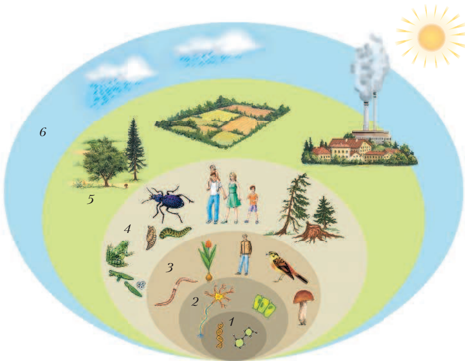
Рис. 2. Структурные уровни организации жизни: 1 — молекулярный; 2 — клеточный; 3 — организменный; 4 — популяционно-видовой; 5 — биогеоценотический; 6 — биосферный