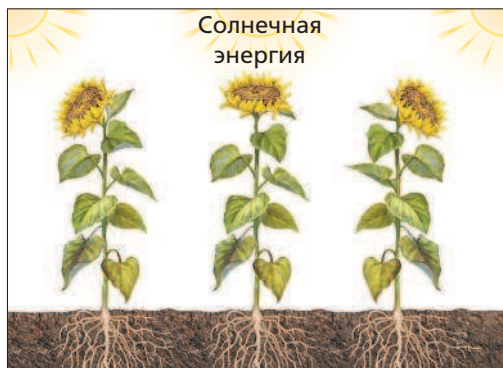
Рис. 1. Суточный ритм движений подсолнечника (фототропизм)

Организмы в процессе своего существования производят огромное по значимости средообразующее действие. Например, дождевые черви участвуют в образовании почвы и повышают её плодородие. Растения обогащают атмосферу кислородом, обеспечивают снегозадержание, регулируют уровень