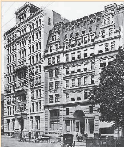
Здание «Стандарт Ойл» в Нью-Йорке

транспорта: автомобиль (Г. Даймлер, К. Бенц), аэроплан (братья У. и О. Райт). Развитие промышленности вызвало появление новых средств связи (беспроволочный телеграф — А.С. Попов и Г. Маркони). В химической промышленности началось производство искусственных красителей, пластмасс. В сельском хозяйстве стали широко применяться минеральные удобрения. Достижения науки и техники проникли непосредственно в домашнюю жизнь: начали использоваться пылесос (1908), аспирин (1899), оказавшийся универсальным лекарством.