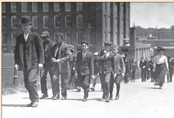
Рабочие-текстильщики в Нью-Хэмпшире. США. 1900-е гг.

Французский писатель Анатоль Франс точно изобразил суть идеалов буржуазного общества: «Закон в своей величавой справедливости даёт право каждому человеку как обедать в ресторане „Ритц“, так и ночевать под мостом».