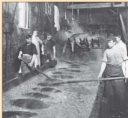
Рабочие стекольного завода. Чикаго. 1905 г.