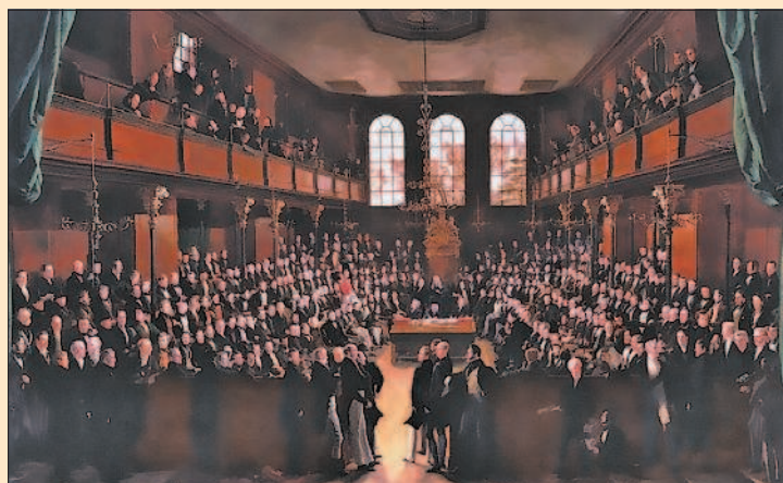
Заседание палаты общин английского парламента. Конец XIX в.

Начало демократическим преобразованиям в Великобритании положили избирательные реформы 1832, 1867, 1884 гг. Каждая из них увеличивала число избирателей и, соответственно, расширяла электоральную базу Консервативной и Либеральной партий. От руководства обеих партий потребовался пересмотр партийных программ, поиск новых лозунгов, способных привлечь избирателей. Вместе с расширением избирательных прав происходит и некоторая демократизация политической жизни Англии в целом: благодаря системе выборов общество получает возможность влиять на