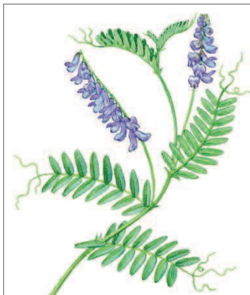
Рис. 4. Побег мышиного горошка

Из деревьев к светолюбивым растениям принадлежит береза повислая. У березы небольшие листья, поэтому ее относят к группе мелколиственных деревьев. На побегах листья располагаются негусто. Если встать под березой и посмотреть вверх, то между олиственными побегами увидим много кусочков