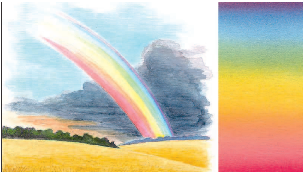
Рис. 3. Радуга. Солнечный спектр

На севере солнечный свет содержит больше синих и фиолетовых лучей, а южнее, особенно вблизи экватора, больше красных. Разные участки солнечного спектра имеют неодинаковое значение в жизни растений. Для фотосинтеза растения используют красные, синие и фиолетовые лучи.