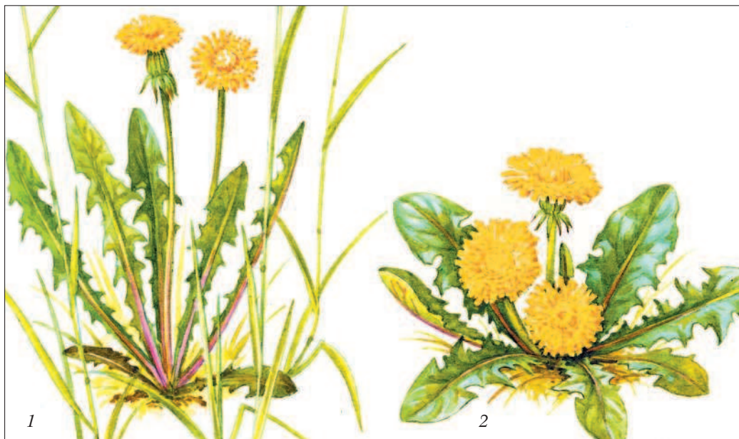
Рис. 2. Растения одуванчика, выросшие среди густого травостоя (1) и на открытом месте (2)

Влияние света на рост растений. Бытует выражение: растения тянутся к свету. Сравним два растения одуванчика лекарственного, выросшие в разных условиях освещения (рис. 2). Если одуванчик вырос в затенении среди густого травостоя, например на опушке леса, то листья у него длинные, расположены почти вертикально, и стебли с соцветиями тоже длинные. Они действительно как бы тянутся к свету, стараясь выбраться из густого травостоя.